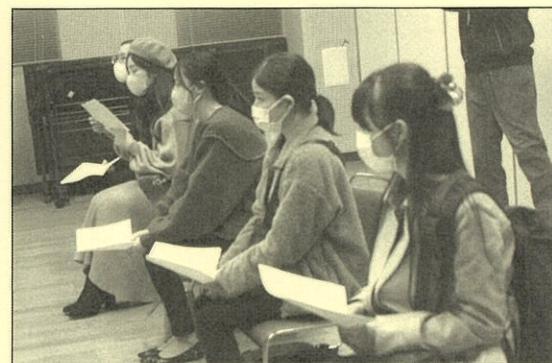
本選抽選会の模様

第33回日本木管コンクール本選とコスモス賞の最終結果は、いよいよ本日の表彰式にて発表される。